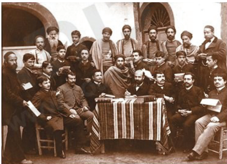
(ק' אביאלי טביביאן, ק'. מסע אל העבר, עולם מודרני נולד, המאה ה-19. תל אביב: מט"ח. עמ' 95)